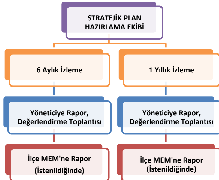
Şekil 2 İzleme ve Değerlendirme Süreci

Müdürlüğümüzün 2019-2023 Stratejik Planı İzleme ve Değerlendirme sürecini ifade eden İzleme ve Değerlendirme Modeli hazırlanmıştır. Okulumuzun Stratejik Plan İzleme-Değerlendirme çalışmaları eğitim-öğretim yılı çalışma takvimi de dikkate alınarak 6 aylık ve 1 yıllık sürelerde gerçekleştirilecektir. 6 aylık sürelerde Okul Müdürüne rapor hazırlanacak ve değerlendirme toplantısı düzenlenecektir. İzleme-değerlendirme raporu, istenildiğinde İlçe Millî Eğitim Müdürlüğüne gönderilecektir.